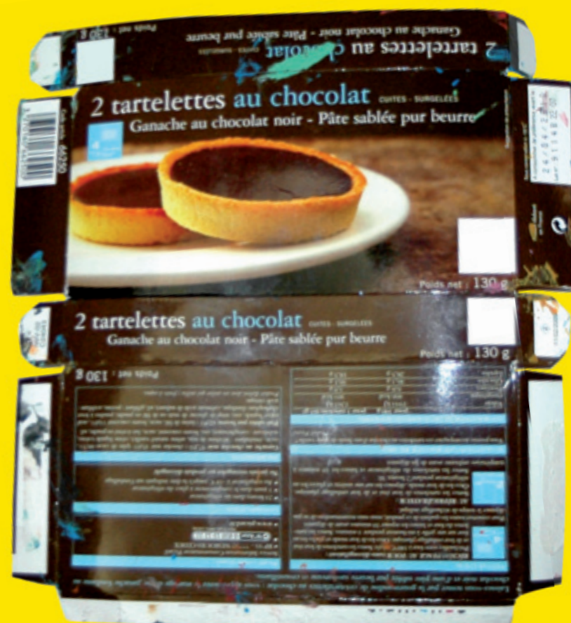
Ateliers Boîtes ouvertes Rémi Courgeon Centre Social et Culturel Danube